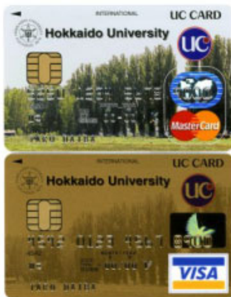
「北海道大学カード」

UCカードは、本カードの募集開始に併せて、入会后3ヶ月以内に3万円以上カードを利用すると、もれなくUCギフトカード2千円分をプレゼントするキャンペーンを実施いたします。同窓会誌などを通じて募集活動を行い、当初1年間で5千人の会員獲得を目指します。