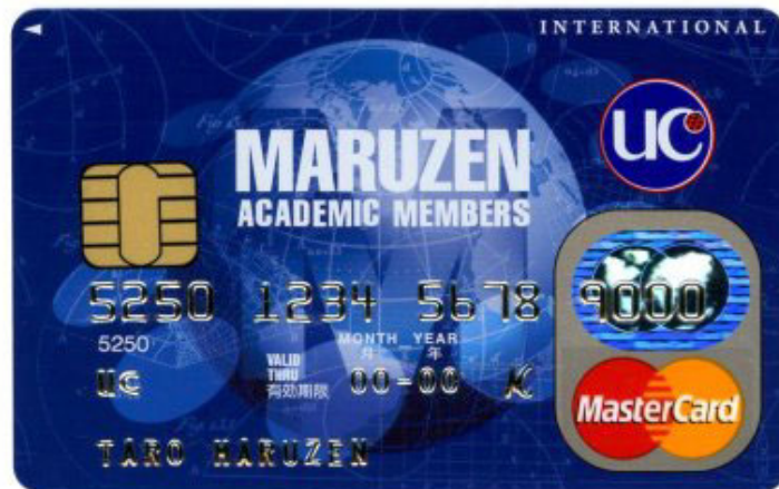
デザインも一新された「丸善アカデミックカード」

丸善は、9月14日、JR東京駅丸の内北口前の「丸の内オアゾ（OAZO）」の商業ゾーンに国内最大級の総面積1,750坪（5,800㎡）、蔵書数約120万冊の総合書店「丸善・丸の内本店」を開業いたします。開業に併せて、両社は本店店頭で「丸善アカデミックカード」の募集活動を行います。