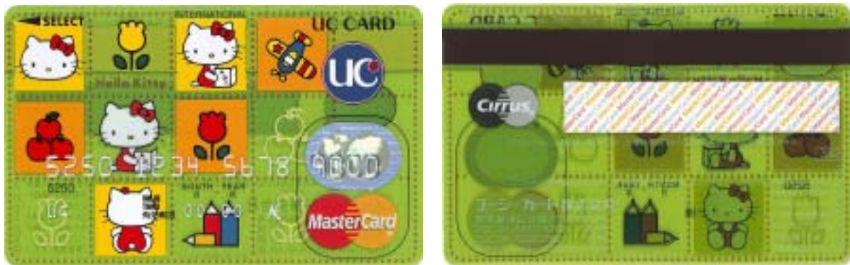
<UCハローキティカード トランスルーセントハローキティ>