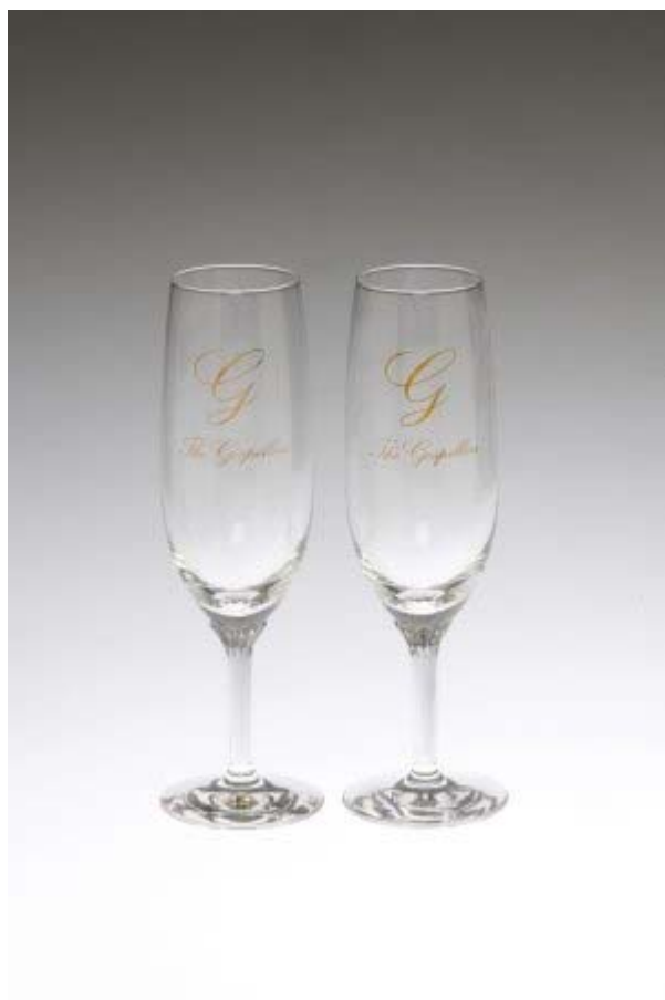
- UCにここにプレゼント「ゴスマニアコース」プレゼントの一例 - シャンパングラスセット（400ポイント）

「UCにここにプレゼント」において、特定の提携カードの会員様を対象にした コースを設定するのは本コースが初めてです。