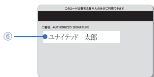
MileagePlus UCカード 裏面 (イメージ)