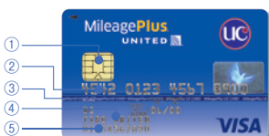
MileagePlus UCカード Visa (一般/セレクト/カレッジ共通)