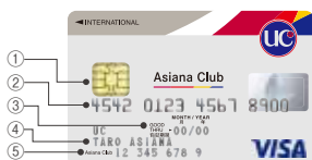
アジアナUCカード(セレクト・一般・学生) Visa