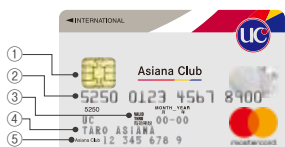
アジアナUCカード(セレクト・一般・学生) Mastercard