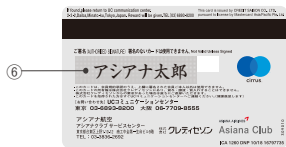
アジアナUCカード(セレクト・一般・学生) Mastercard 裏面