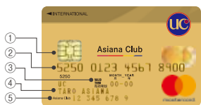
アジアナUCゴールドカード Mastercard