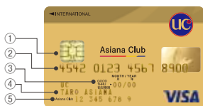
アジアナUCゴールドカード Visa