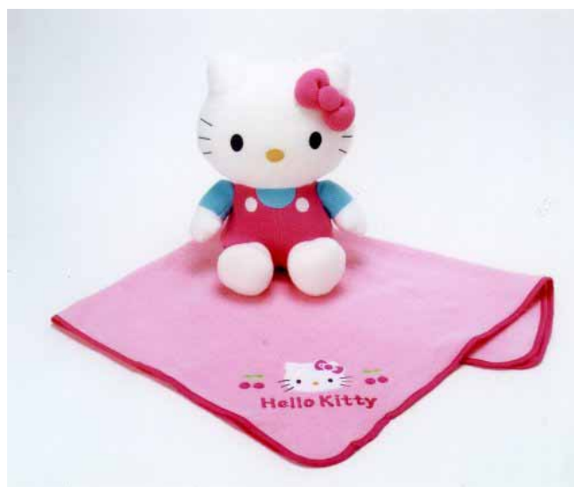
- 「UCにここにプレゼント2005ハローキティコース」プレゼントの一例 - ブランケット入りぬいぐるみ（400ポイント）

UCカード会員様は、ブランケットを収納できるぬいぐるみをはじめ、「ハローキティ」グッズ10種類から、お持ちのポイントに応じてご希望のプレゼントと交換いただけます。