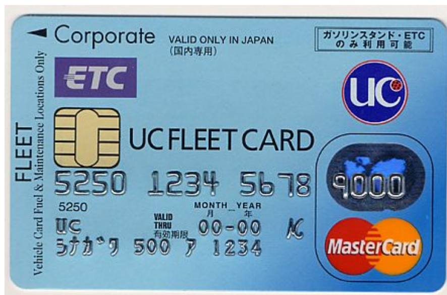
UCフリートカード ※導入企業独自デザインを採用可能

UCカードは、第一弾として、2005年3月以降、東京オートリース株式会社、センチュリー・オート・リース株式会社、興銀オートリース株式会社、芙蓉オートリース株式会社に「UCフリートカード」を順次導入いたします。UCカードでは、今後、他のオートリース会社や車両管理サービス提供会社をはじめ、運送業などの多数の車両を保有する企業に導入を推進してまいります。