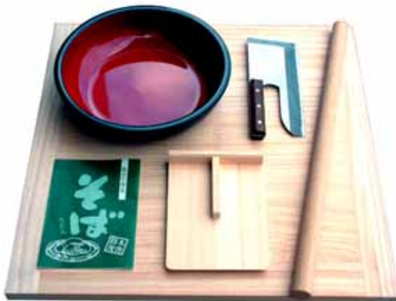
お父さんのチャレンジ「麺打ちセット」 2,200ポイント

「UC にここにこプレゼント」は、カード利用金額に応じてポイントがたまり、たまったポイントを約170種類のプレゼントと交換できるポイントプログラムで、会員様からの支持が最も高いサービスの1つです。UCカードはこれまでも商品ラインナップの充実や期間限定コースの実施、ポイント移行企業の拡大などポイントプログラムの魅力向上を図ってきています。UCカードは、今後も時流にあった魅力ある商品を「UC にここにこプレゼント」の商品として取り入れ、会員様の満足度向上を図ると共に、さらなるUCカードの利用促進を目指します。