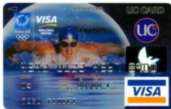
「アテネオリンピック記念 UC-VISA カード」